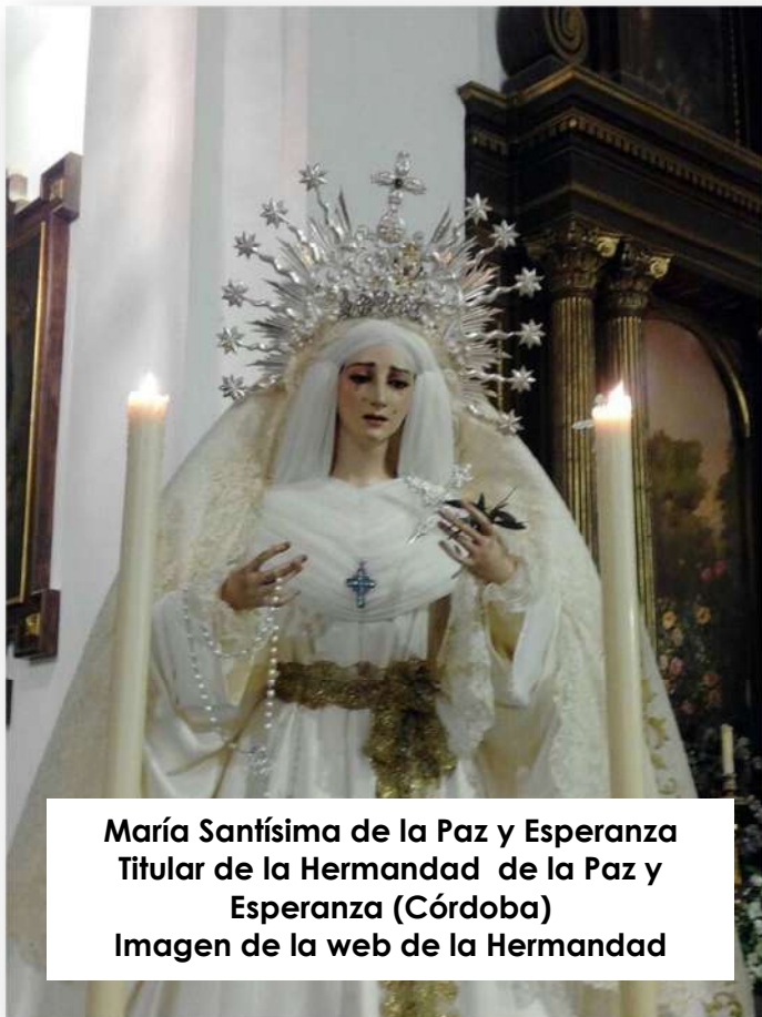
María Santísima de la Paz y Esperanza Titular de la Hermandad de la Paz y Esperanza (Córdoba)

producción artística, y lo que han supuesto sus imágenes para miles y miles de fieles y devotos. Yo soy una de esas personas que reza y se encomienda ante dos tallas de Cerrillo, los Titulares de la Hermandad de la Paz y Esperanza de Córdoba. Por eso agradezco de corazón la oportunidad que me brinda la Hermandad de Nuestro Padre Jesús Nazareno y Señor del Huerto de San Sebastián de los Ballesteros de poder expresar, modestamente, la importancia del legado del imaginero de Bujalance.