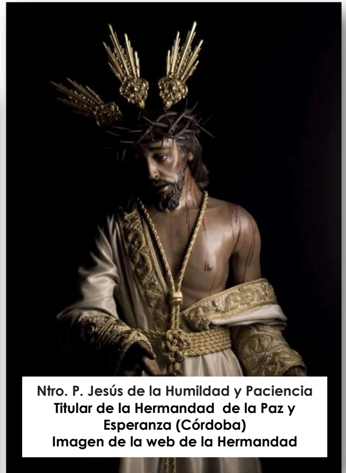
Ntro. P. Jesús de la Humildad y Paciencia Titular de la Hermandad de la Paz y Esperanza (Córdoba)

en el taller de Martínez Cerrillo en la calle Enrique Redel, admirar su obra, sus escritos, bocetos, esculturas y pinturas, te hace sentir muy cerca del que fue un artista de fe, un hombre marcado y responsabilizado por el momento que le tocó vivir y que puso su arte al servicio del pueblo, del mundo cofrade y de la Semana Santa de Córdoba y provincia.