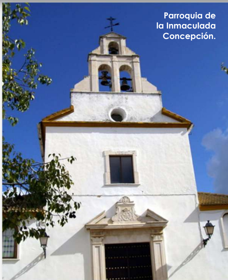
Parroquia de la Inmaculada Concepción.

Hoy en día vivimos mirando al suelo, es decir, muy preocupados por las cosas de esta tierra, que no son malas. Pensamos que cuanto más tenemos, más