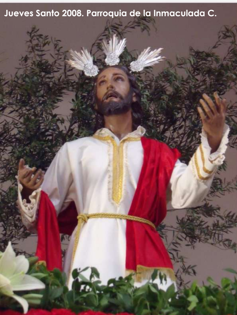
Jueves Santo 2008. Parroquia de la Inmaculada C.

También deseo dar un sincero "gracias" a aquellos hermanos que desinteresadamente han trabajado para mantener la identidad e historia de nuestra hermandad; a aquellos que, con su generosidad, han colaborado en acciones de caridad para ayudar a otros;