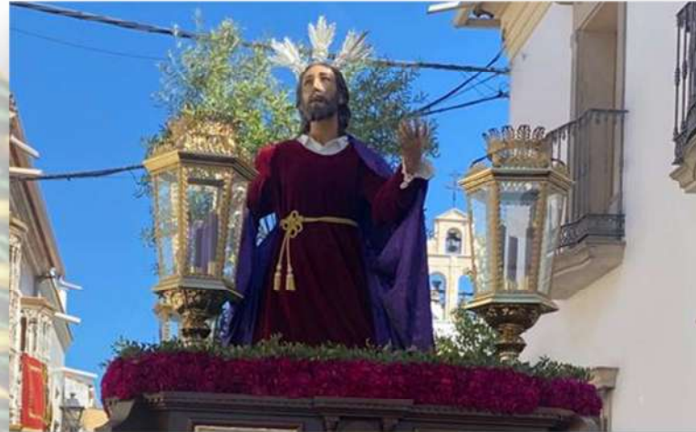
Domingo de Ramos 2023. Calle Carlos III

lo celebremos como ya hicimos en 2019, en la conmemoración del LXXV aniversario de Nuestro Padre Jesús Nazareno, siendo ejemplo de hermandad y de pueblo. Así escribimos una página más en la historia de San Sebastián de los Ballesteros.