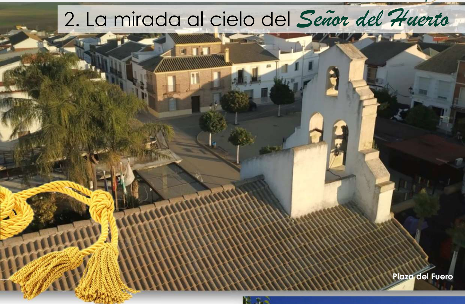
Plaza del Fuero

Desde aquí quiero felicitar a la Hermandad de Nuestro Padre Jesús Nazareno y Señor del Huerto por sus 25 años de la venida de la Imagen del Señor del Huerto a nuestro pueblo, 25 años disfrutando de su bendito rostro.