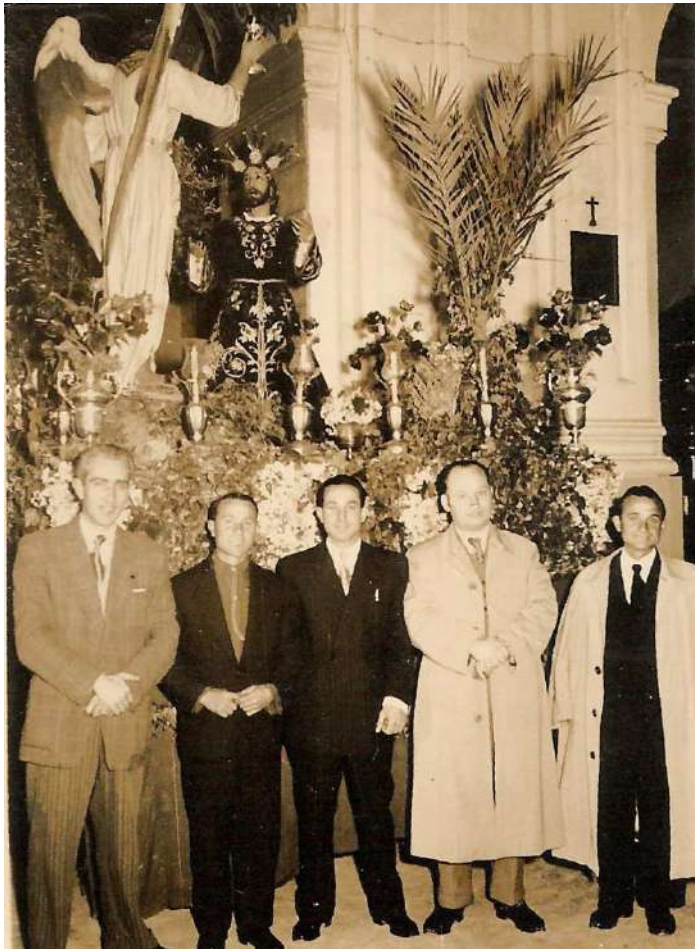
Cofradía de Jesús Orando en el Huerto - 1956

A ninguno de nosotros —me atrevería a asegurar— le cabe duda de que los comienzos, en todas las Hermandades son muy difíciles. Bien, pues también lo fueron para ellos, pues entre sus primeros objetivos residía su compromiso de la restauración del lugar en que la Cofradía ubicaría su sede, la Ermita de la Caridad; Ermita que había sido, muchos años antes, hospital y asilo de peregrinos desamparados y niños abandonados. “¡Caridad a raudales! ¡Caridad de caridad ilimitada!”, como dice nuestro cronista y paisano Francisco Crespín en su libro Piedras y Cruces .