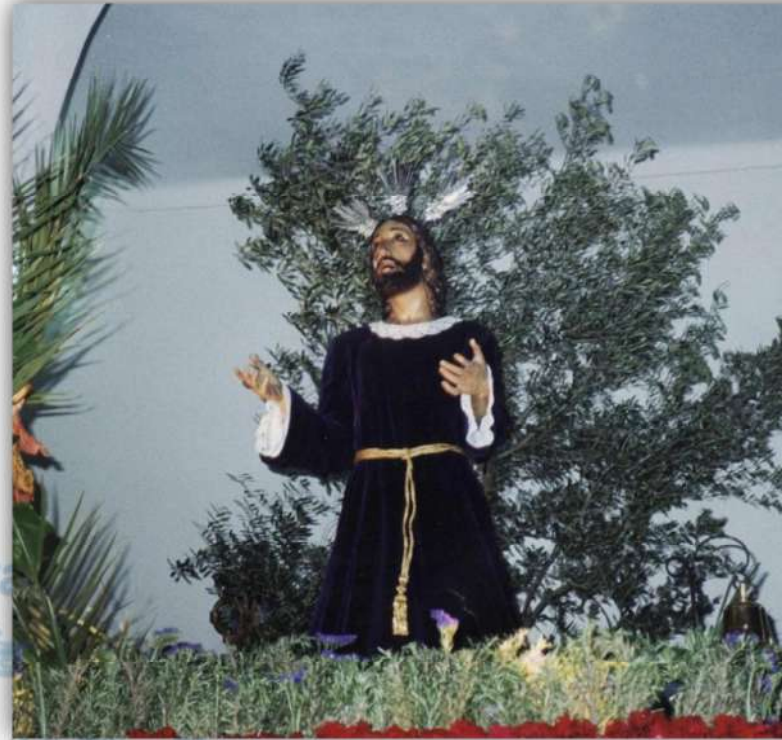
El Señor del Huerto con la primera túnica que se hizo.