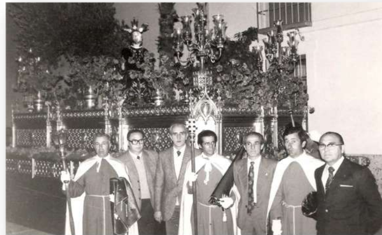
Estrenando su trono en su primera salida - 1975

Bien, pues la Cofradía del Huerto, como familiarmente siempre se le ha llamado, con las apenas 261 pesetas que contaba, cual Ave Fénix, renace de sus cenizas y comienza a invertir ese dinero en reconstruir la Ermita, sin ayuda oficial de ningún tipo; con la ayuda de los vecinos que participaban en las diversas actividades que organizaba la cofradía y recaudar así fondos para tal fin. Destaca entre aquellas ayudas la del escultor don Juan Polo Velasco en la reconstrucción del Altar Mayor de la Ermita.