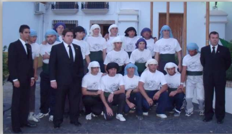
Primera cuadrilla de costaleros del Señor del Huerto. Año 2008.