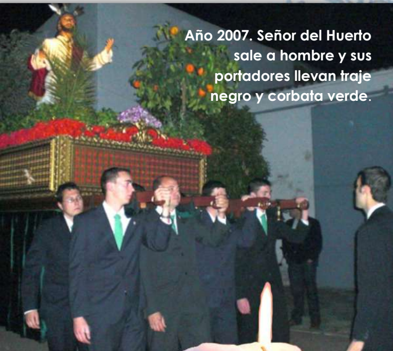
Año 2007. Señor del Huerto sale a hombre y sus portadores llevan traje negro y corbata verde.