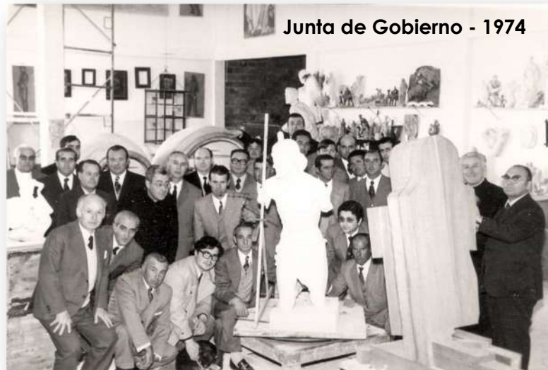
Junta de Gobierno - 1974

nos concedió a todos, años, sin duda, de esplendor, de felicidad y de gloria.